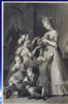
Copertina del "Werther" di Goethe